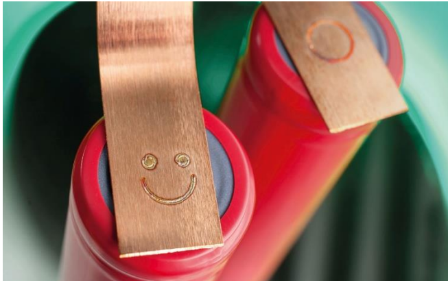
Bild 1: Laser ermöglichen in der Batterietechnik schon heute präzise und stabile Verbindungen: Mit dem Laserbonden lassen sich z. B. Kupferbändchen auf Batteriezellen schweißen.

FRAUNHOFER-INSTITUT FÜR LASERTECHNIK ILT